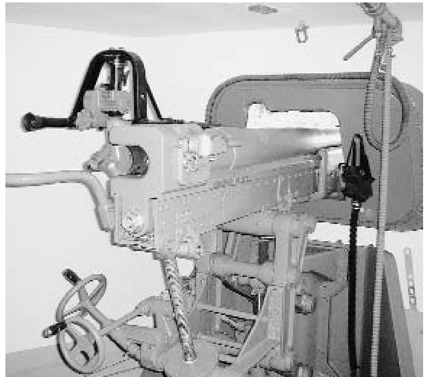
Am Tag der offenen Tür erstmalig im Einsatz: die Kanone 03 des Bunkers Kaltenboden 2 in Schindellegi.

Zu diesem Zeitpunkt wurde die Stiftung Schwyzer Festungswerke gegründet. Deren Ziel ist es, einige repräsentative Anlagen der Öffentlichkeit zugänglich zu machen und für die nachfolgenden Generationen zu erhalten. Die Stiftung musste jedoch schnell handeln, bevor alles Material verschrottet war. So sind folgende Anlagen, auf den ganzen Kanton verteilt, übernommen worden: Grynau, Sihlsee, Sattel, Selgis (Muotathal) und neu auch Etzel. Mit viel Fleiss haben einige freiwillige Helfer die Bunker in Schindellegi wieder hergerichtet. Ins-